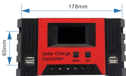
安装孔距— \varnothing 5 Mounting hole Size