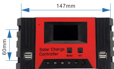
安装孔距— \varnothing 5 Mounting hole Size